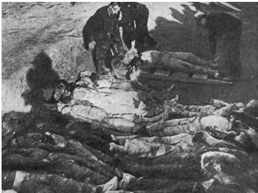
Exhumácia patizánskych obetí, Sklené, október 1944

dia, boli ľudia, čo ich sťahovali z kože zaživa. Bol aj neľudský koncentrák v Slovenskej Ľupči, so všetkým, čo k tomu patrí – mučenie, vraždenie... Výborný fabulátor a poslabší filozof Umberto Eco, ktorého tak hltajú aj naši súčasní stachanovci pokroku a demokracie, vo svojej knihe o morálke napísal jednu úvahu, s ktorou pokojne môžeme súhlasiť: Netolerovateľné. Jednoducho, sú neslýchané zločiny, ktoré prekračujú všetky normálne obzory. Tie sú jednoducho netolerovateľné. „Nové netolerovateľné nie je iba genocída, ale jej teoretizácia.“ Tu musím dodať, že ešte viac jej obhajovanie či bagatelizovanie. A určite najviac jej oslava. Pre istotu, ak by to niekto prehliadol, či už kvôli rýchlemu čítaniu, či menším písmenám, pripomeniem ešte raz, čo sa tu dialo: MASOVÉ VRAŽDY CIVILNÉHO OBYVATELSTVA. Alebo akými veľkými písmenami to mám napísať, aby si náš boľševický dorast uvedomil, čo to boli za zločiny? Spomeňme si, prečo sa „nacizmus“ stal neslušným slovom. Nie kvôli tvrdému režimu, ani kvôli KdF, dokonca ani kvôli vojne nie, veď vtedy to bol bežný spôsob „riešenia“ medzinárodných problémov (nakoniec, tak ako dnes) – nie,