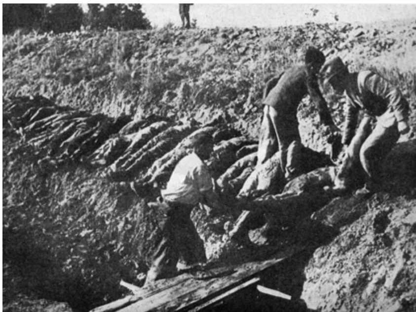
Exhumácia patizánskych obetí, Sklené, október 1944

Boli sme pevne presvedčení, že budeme nasadení k zemným prácam a že sa večer znova vrátíme domov. Pri strážnom domčeku v blízkosti „rovinného lesa“ vlak zastavil. Otvormi nákladného železničného vagóna sme videli, ako bolo z niekoľkých vagónov vybraných približne 20 až 30 mladých, silných mužov. Boli vybavení krompáčmi a lopatami a odvedení do lesa, kde na úpätí úbočia vedľajšej koľaje, ktorá videla k poľnému leťisku, začali kopať.